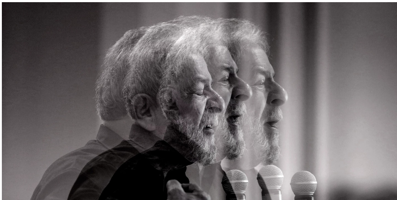
Photo en exposition multiple de l'ancien président Luiz Inácio Lula da Silva pendant un discours à São Paulo, le 21 septembre 2017.