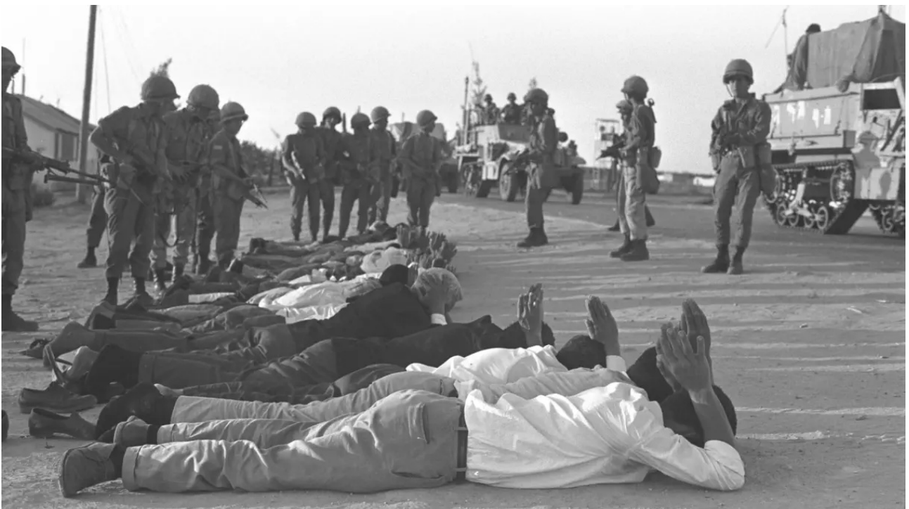
Israeli troops guarding captured Egyptians and Palestinians lying on a roadside at Rafah during the Six-Day War, June 1967.

En mode d'occupation classique, Israël a touché le fond. Et maintenant, il est trop tard.