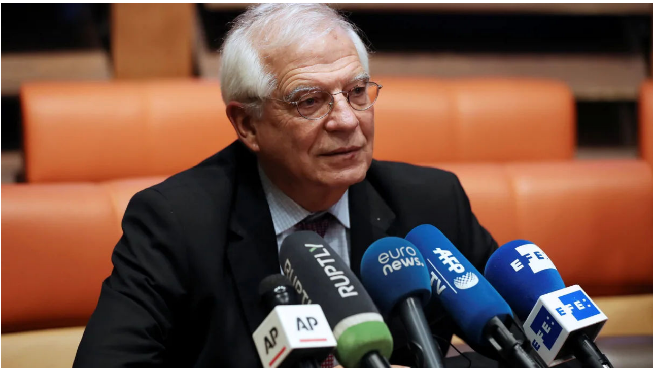
European Union foreign policy chief Josep Borrell gives a press briefing after his