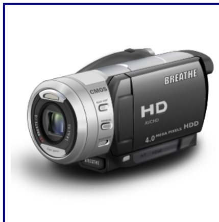
Vidéo de l'entretien (en anglais)

" Je pense que tout le monde devrait se révolter contre cela ", a déclaré Netanyahu dans une entrevue réalisée par Matt Crouch de Trinity Broadcasting Network, le plus grand réseau de télévision évangélique chrétienne au monde, alors que des dizaines de dirigeants mondiaux se sont réunis à Jérusalem pour le Forum mondial sur l'Holocauste qui aura lieu jeudi. Netanyahu devrait utiliser ce rassemblement comme plate-forme pour exhorter les dirigeants du monde à soutenir Israël contre la CPI.