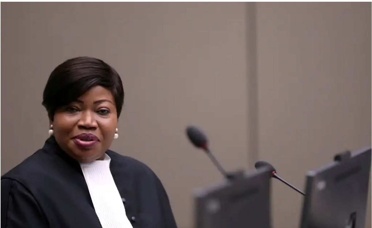
ICC Chief Prosecutor Fatou Bensouda during a trial at The Hague, July 8, 2019.

nétanyahou fait semblant d'ignorer que les donneurs d'ordres ne sont ni de simples soldats ni de simples citoyens... NdT